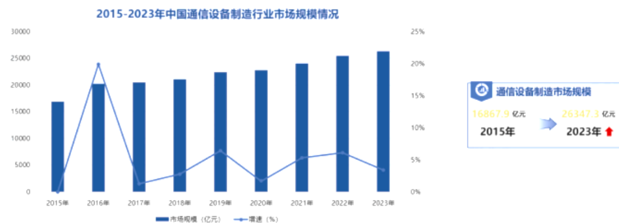
图 1: 2015-2023 年中国通信设备制造行业的市场规模