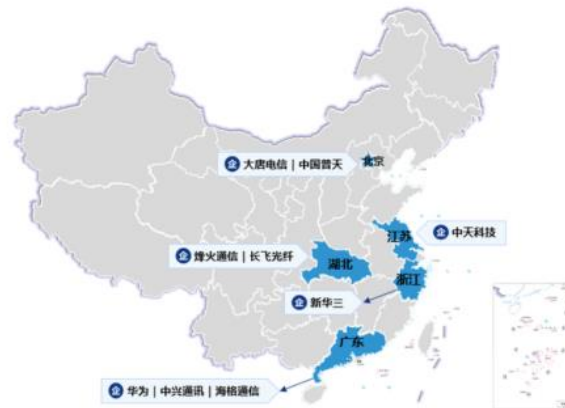
图 2: 中国通信设备制造行业主要厂商分布地图

中兴通讯股份有限公司成立于 1985 年, 致力于提供综合通信解决方案。公司的产品线丰富, 包括无线、有线、业务及终端产品等, 能够为全球超过 160 个国家和地区的客户提供专业的通信服务。在全球通信设备市场中, 中兴通讯的份额占到 11%, 2023 年实现营收 1200 亿元, 实现净利润 93 亿元。